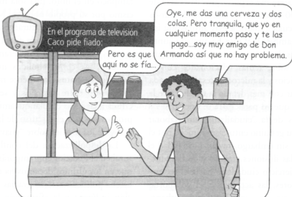
Capítulo 2: El lugar donde vivimos.

En Ecuador conviven gran cantidad de culturas de diferentes orígenes, que comparten el sentimiento de pertenencia a su país, tienen una misma nacionalidad y se identifican como ecuatorianos. Esta diversidad es uno de los factores que más lo caracteriza (MIMG: 39).